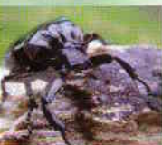
Eremit oder Juchtenkäfer