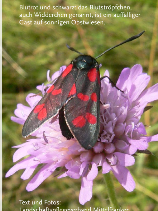
Blutrot und schwarz: das Blutströpfchen, auch Widderchen genannt, ist ein auffälliger Gast auf sonnigen Obstwiesen.

Ansprechpartner: Landschaftspflegeverband Mittelfranken Feuchtwanger Straße 38, 91522 Ansbach, www.lpv-mfr.de , Tel.: 0981 4653 3520